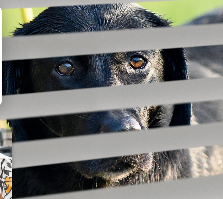
door Femke Lagaaij